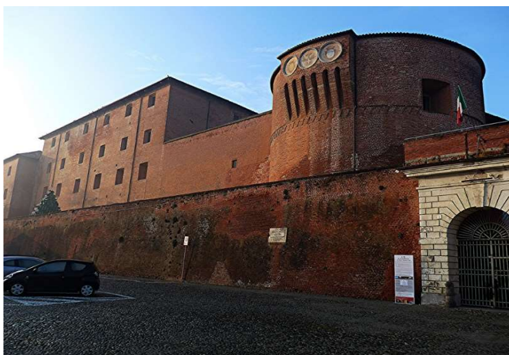
Entrata della "Castiglia"